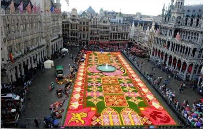
Et encore la place Royale,