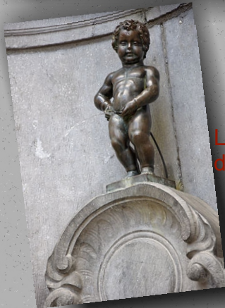
Le monument de Christophe Colomb,