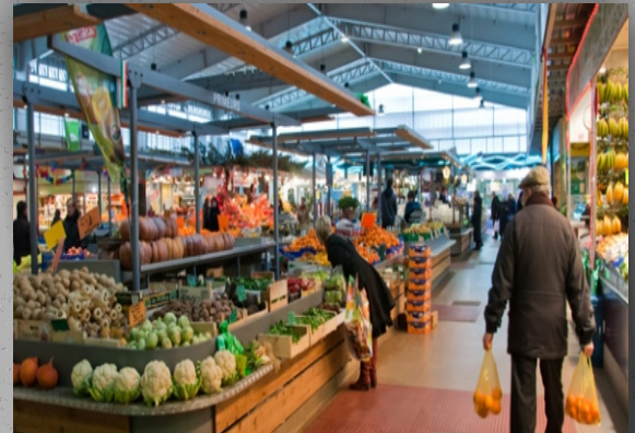
Le Stade Olympique...